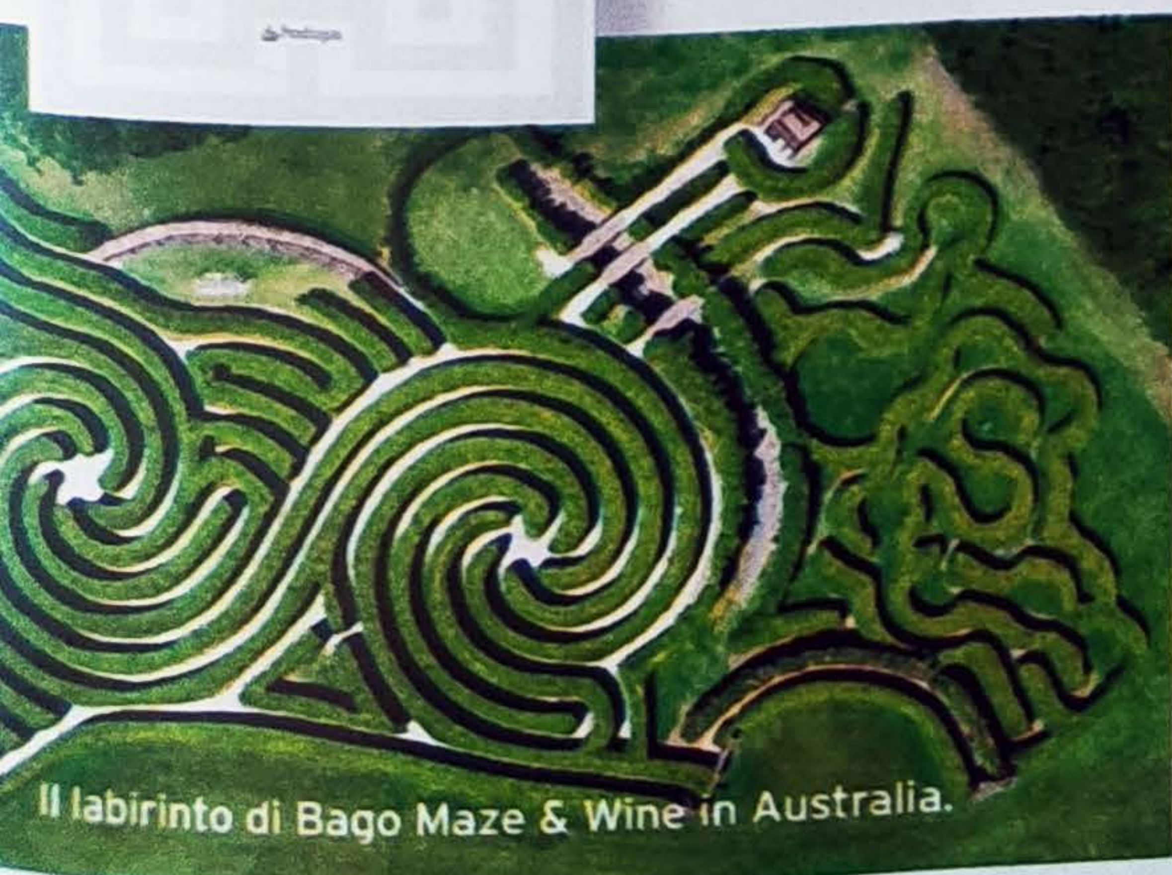
Il labirinto di Bago Maze & Wine in Australia.