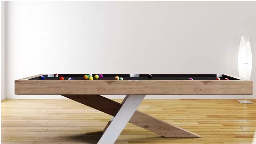
Kulečnickový stůl přijde vhod do všech prostorově rozměrnějších herních místností. Foto: Luxury of homes, Cirillo Biliardi

Ti, kdo milují kulečník, si mohou domů pořídit kulečnickový stůl, který dnes už může mít velmi moderní vzhled s čistými a minimalistickými liniemi. Pro fanoušky fotbalu tu jsou zase plnohodnotné stoly s fotbalkem, pro další třeba pingpongové stoly.