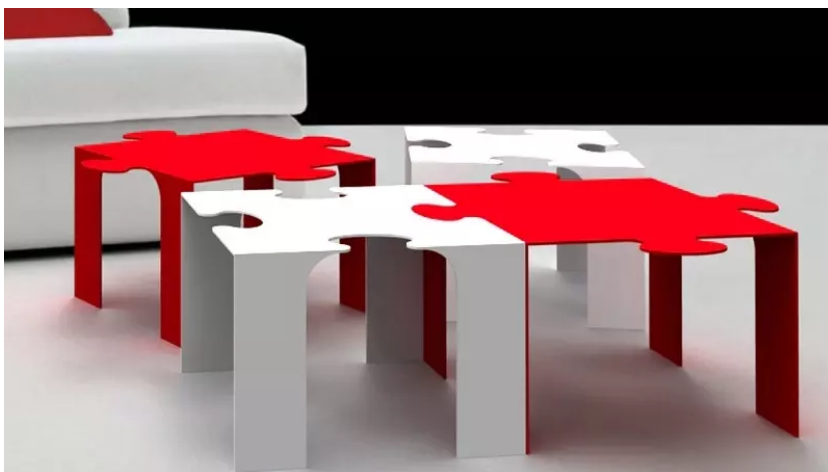
Konferenční stolec inspirovaný hrou puzzle pobaví děti i dospělé.

V interiéru uplatníte nábytek inspirovaný hrami. Prim tak budou hrát i kousky inspirované skládkou puzzle, ať už jde o stolky nebo police. Stěny pak můžete vyzdobit rozměrnějšími obrázky poskládanými právě z puzzle.